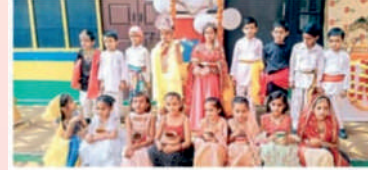
कार्यक्रम में बच्चों द्वारा निकाली गई झांकियां।

सखेरा न्यूज/नड्डा : विलासपुर, 25 अगस्त : घुमारवीं शहर में स्थित हिम सर्वोदय स्कूल में कृष्णा जन्माष्टमी पर कार्यक्रम का आयोजन किया गया, जिसमें पहली