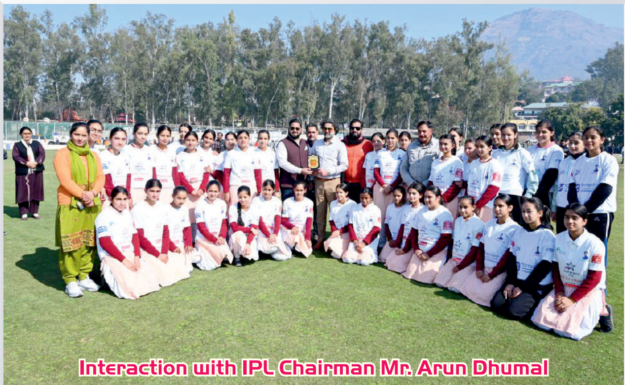
Interaction with IPL Chairman Mr. Arun Dhimal