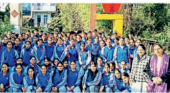
हिम सर्वोदय स्कूल के विद्यार्थियों बायोटेक लेबोरेट्री खेल के प्रभाग के दौरान • जम्वाल

संवाद सखेरी, जामरणा • दक्षी बंड : हिम सर्वोदय स्कूल के विद्यार्थियों बायोटेक लेबोरेट्री खेल के प्रभाग के दौरान • जम्वाल