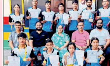
भारतीय विजेता खिलाड़ियों का स्वागत करने हुए स्कूल प्रबंधक।